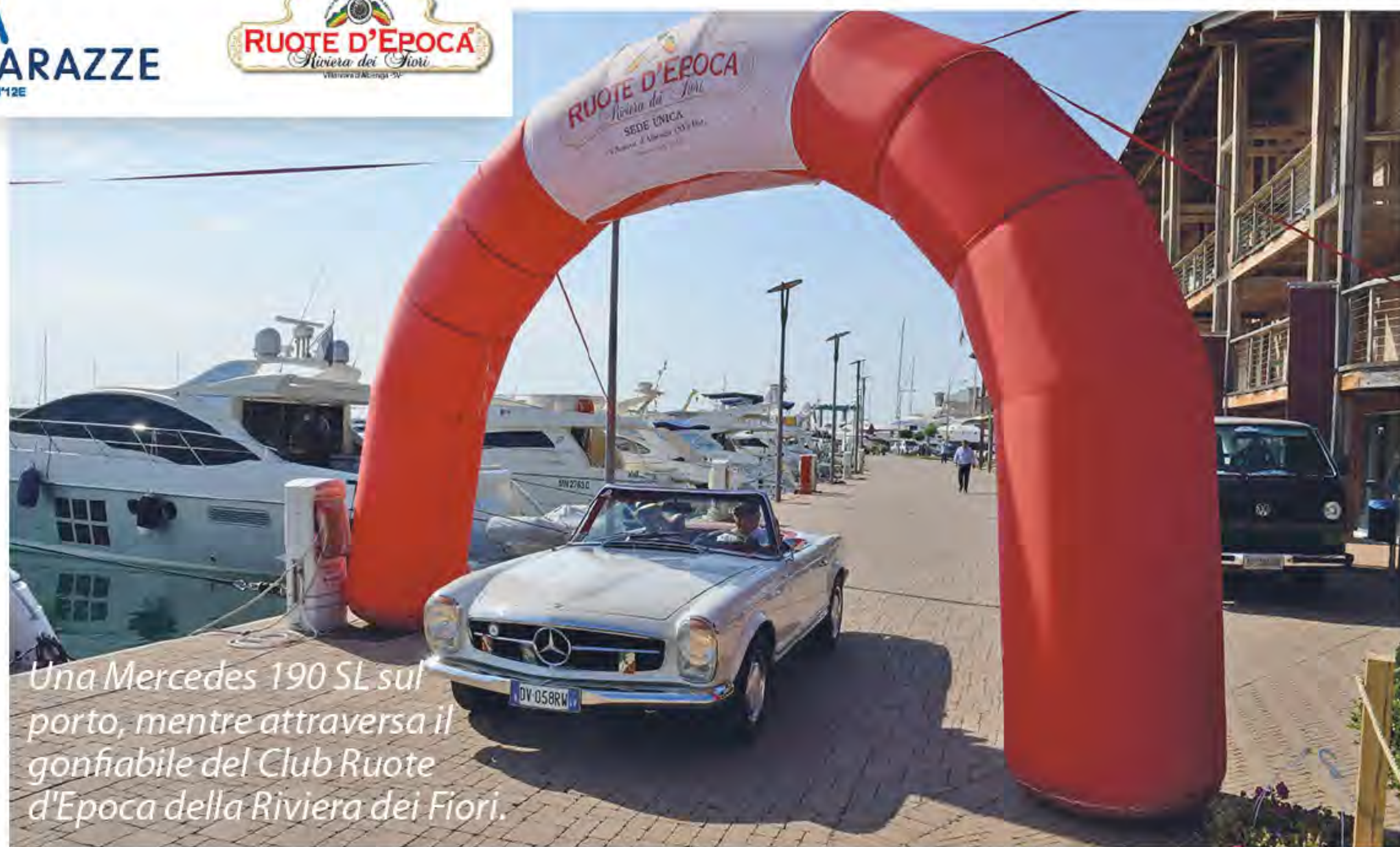
Una Mercedes 190 SL sul porto, mentre attraversa il gonfiabile del Club Ruote d'Epoca della Riviera dei Fiori.